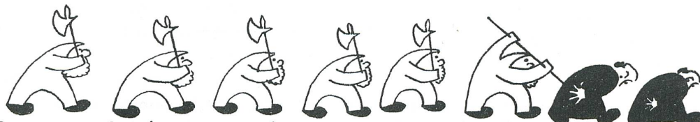
Tod des deutschen Kaisers. Um die freigewordene Stelle streiten sich ein Habsburger und ein Bayer. Die Eidgenossen unterstützen den Letzteren und machen einen Angriff auf das Kloster Einsiedeln.