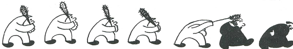
Tod des deutschen Kaisers. Um die freigewordene Stelle streiten sich ein Habsburger und ein Sachse. Die Eidgenossen unterstützen den Letzteren und machen einen Angriff auf das Kloster Einsiedeln.