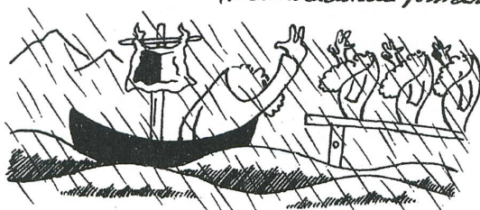
Luzern schliesst sich dem Bund an.