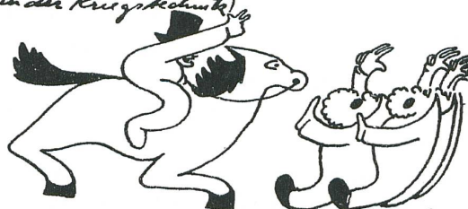
Zürich, von Oesterreich mit Krieg bedroht, schliesst sich in höchster Eile dem Bund an.