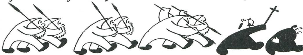
Daraufhin machen sie einen Angriff auf das Kloster Einsiedeln. (Man beachte die Fortschritte in der Kriegskunst.)