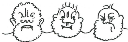
Dein Kaiser lebt ausserordentlich lang. Die Eidgenossen sind in grosser Flegenheit.