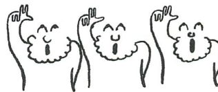
„Deshalb kommen sie zusammen und rebwören;“ hier wollen sein ein einzig Volk von Brüdern.“