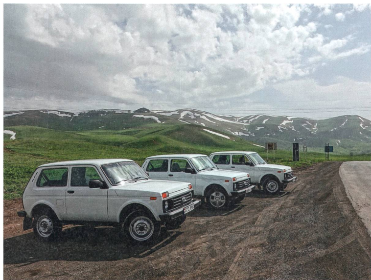
Mit drei Lada Nivas unterwegs in Arzach, fotografiert von Lukas Rühli.