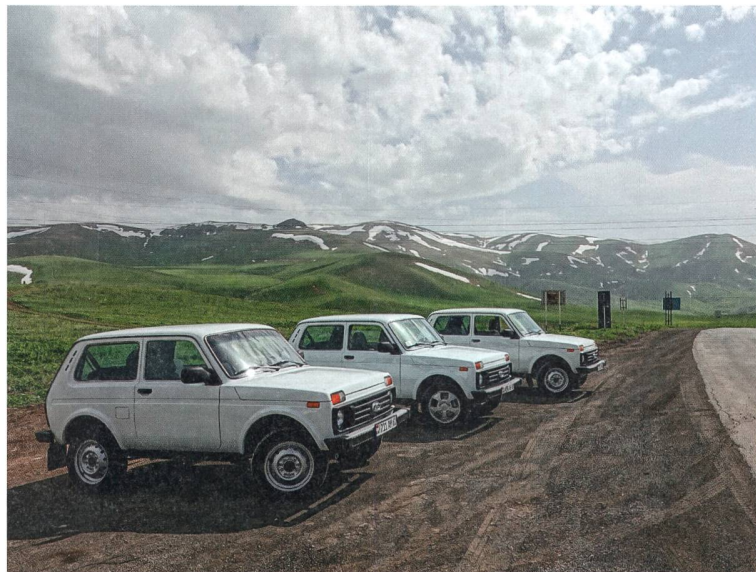
Mit drei Lada Nivas unterwegs in Arzach, fotografiert von Lukas Rühli.