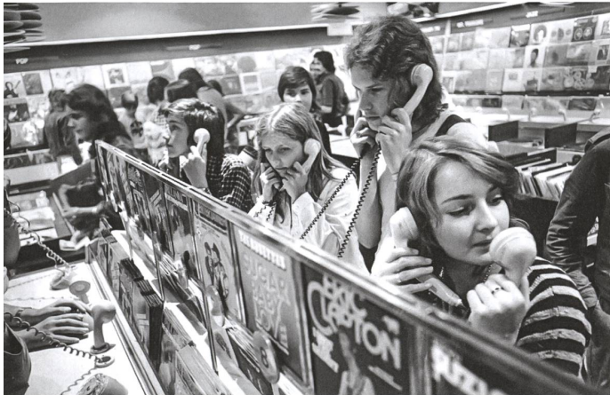
Im Plattenladen im Globus an der Löwenstrasse.