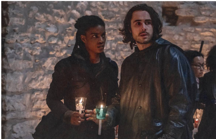
Agentin 355 (Ashley Romans) und Yorick Brown (Ben Schnetzer), der letzte Mann der Welt.