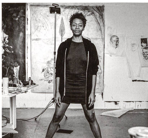
Kara Walker