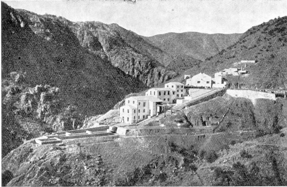
Fig. 1. Vue d'ensemble de l'usine de flottation.

Sortant du cadre strictement scientifique réservé aux précédentes études, j'exposerai ici la mise au point pratique de la flottation du minerai d'Azegour. J'insisterai en premier lieu sur l'importance de la connaissance pétrographique du minerai pour résoudre correctement cette question d'ordre technique.