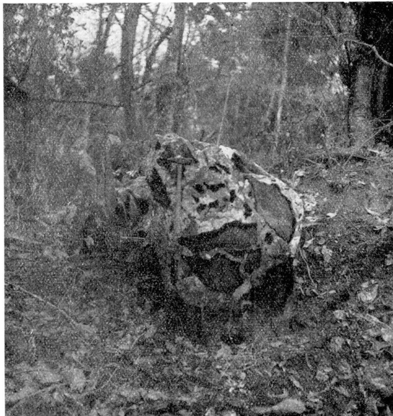
Figur 2. Kontaktmarmor

Struktur hypidiomorph, lokal granophyrisch.