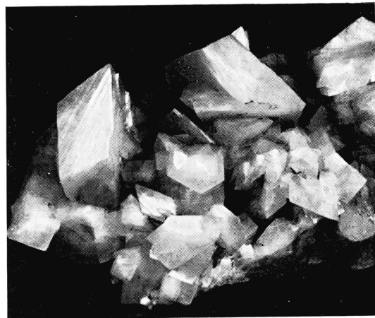
Fig. 2. Adularstufe aus dem Fund von Stgegia. Bezeichnend ist hier das gleichmässige Auftreten der scharfkantigen Kristalle, welche die Kluftwände wie mit einem Rasenteppich überziehen. Ca. \frac{1}{2} nat. Grösse.

lera. Zudem weisen die Kristalle eine unregelmässige, weisse Durchaderung auf, was ihnen ein geflecktes Aussehen verleiht. Der Albitgehalt liegt im Vergleich zu anderen Vorkommen dieser Gegend eher niedrig.