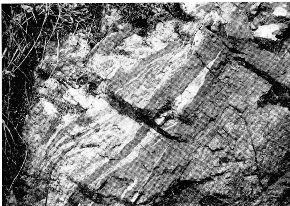
Fig. 2. Manifestazioni feldspatico-corindonifere nella granulite a corindone. (Croso della Gavala-Valsesia, Vercelli.)

di granato e da pirosseno rombico. Un primo esame ha rivelato anche nella granulite, comprendente i filoncelli feldspatici, numerosi cristalli di corindone, cosa questa che ha consigliato uno studio particolare trattandosi di un fenomeno non ancora conosciuto nella formazione basica Ivrea-Verbano.