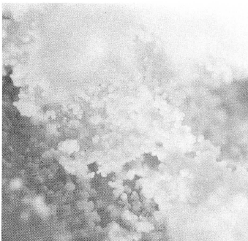
Abb. 3 Weilerit (sulfatfrei) in sphärolithischen Aggregaten. Grube Clara. Vergr. ca. 46 x.

gaten bestehende Krusten von weisser bis gelblich-weisser Farbe auf Schwer- spat (Abb. 3). Der Durchmesser der Sphärolithe erreicht knapp 0,05 mm.