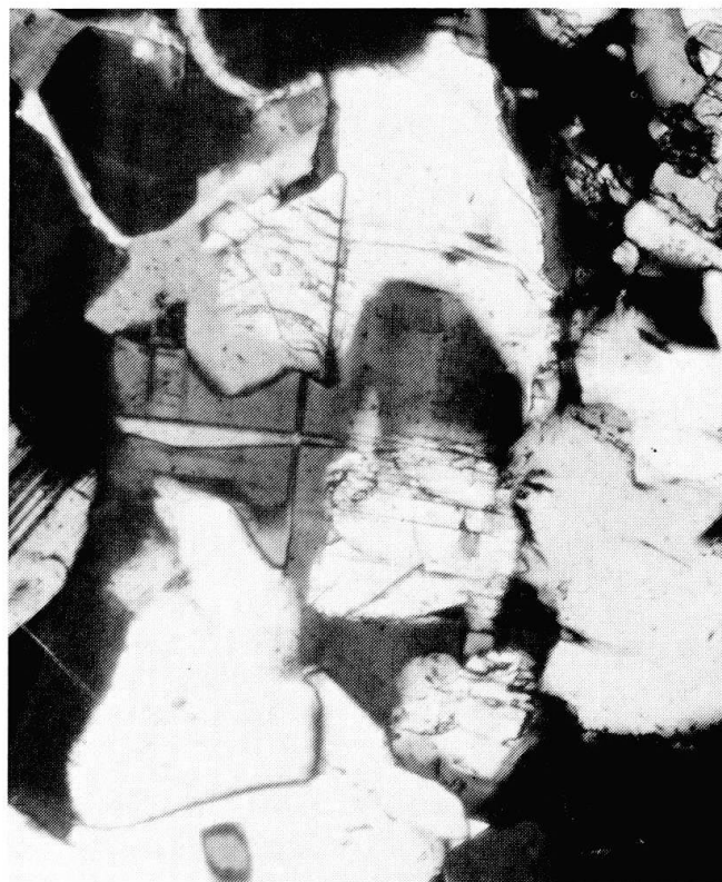
Figur 2 Mikrophotographie des in Figur 1 rechts unten dargestellten Karlsbad-Zwillings mit orientierter Verwachsung von Bytownit mit Andesin.

Das Gestein wurde darauf erneut mikroskopisch untersucht, und im Quarzgefüge konnten wenige nach dem Albit- und Periklin-Gesetz verzwilligte Andesine An 39–47 bestimmt werden, sowie vereinzelt Bytownit An 85–90 ummantelt von Andesin An 45–47 (Figur 1). Im ersten Beispiel der unteren Reihe von Figur 1 durchzieht eine Albitlamelle sowohl den korrodierten Bytownitkern als auch den Andesinrand. Es könnte hier an sekundäre Verzwilligung nach der Umwachsung gedacht werden. Im zweiten Beispiel, ebenfalls einem Albitzwilling, konnte ( \bar{2}01 ) als Kontaktfläche beider Plagioklase bestimmt werden. Die beiden letzten Körner der Figur sind am instruktivsten: Wohl ist wiederum Bytownit älter als Andesin, und es sind einfach indizierte gemeinsame Verwachsungsebenen vorhanden, aber es handelt sich um Karlsbad-Zwillinge, die nicht sekundär entstehen können (siehe auch Fig. 2). Die Zeitfolge Andesin nach Bytownit ist aus allen vier Beispielen ablesbar. Andesin hat nach einer Korrosionsphase Bytownit orientiert umwachsen und dessen Zwillingsindividuen abgebildet. Es handelt sich bei diesen Verwachsungen Bytownit-Andesin also um andere Erscheinungen als die früher geschilderten, gleichzeitigen