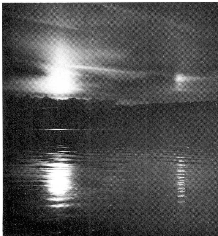
Abb. 2: Sonne und Nebensonne spiegeln sich in längeren Lichtstrassen auf ruhigerer Seeoberfläche.

Da es sich hierbei, im Gegensatz zur Lichtstrasse auf ruhigeren Gewässern, nicht nur um gewöhnliche Reflexion handelt, sondern zum Teil sogar um Totalreflexion, ist die Lichterscheinung solcher Neben- und Unternebensäulen erheblich.