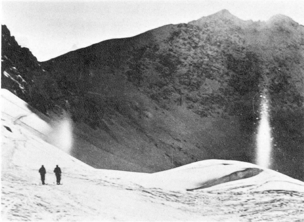
Abb. 3: Untere Lichtsäule mit ebenfalls weisser Unternebensäule auf Weissfluhjoch (nach M. Jaggi).

Ein Hauptargument für diese Ansicht bieten zwei Beobachtungen von verschieden hohen Sonnenständen mit ihren Säulen und Nebensäulen, welche letztere beide den gleichen, minimalen Abstand vom Sonnenvertikal aufweisen, die eine Beobachtung bei einem Sonnenstande von ca. 5^\circ , die andere jedoch bei 15^\circ . (Die Bilder wurden gezeigt.)