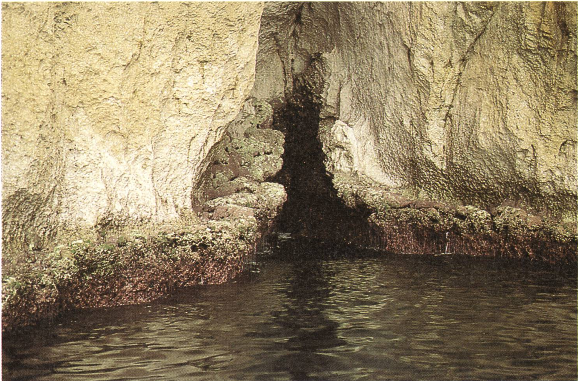
Fig. 2 Primo piano della concrezione di Lithophyllum lichenoides su una falesia calcarea dell'Isola Tavolara.