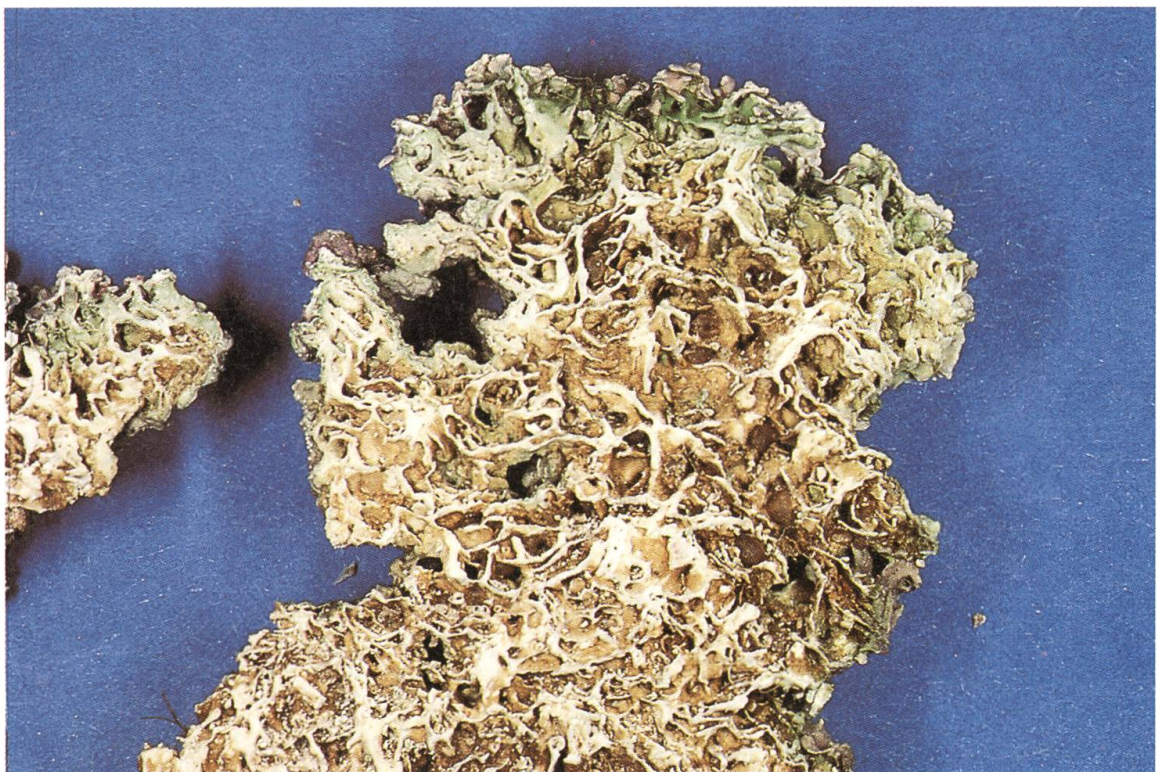
Fig. 3 Particolare della sezione trasversale della cornice di Lithophyllum lichenoides in cui si evidenziano i talli dell'alga che formano numerose cavità anastomizzate fra loro.