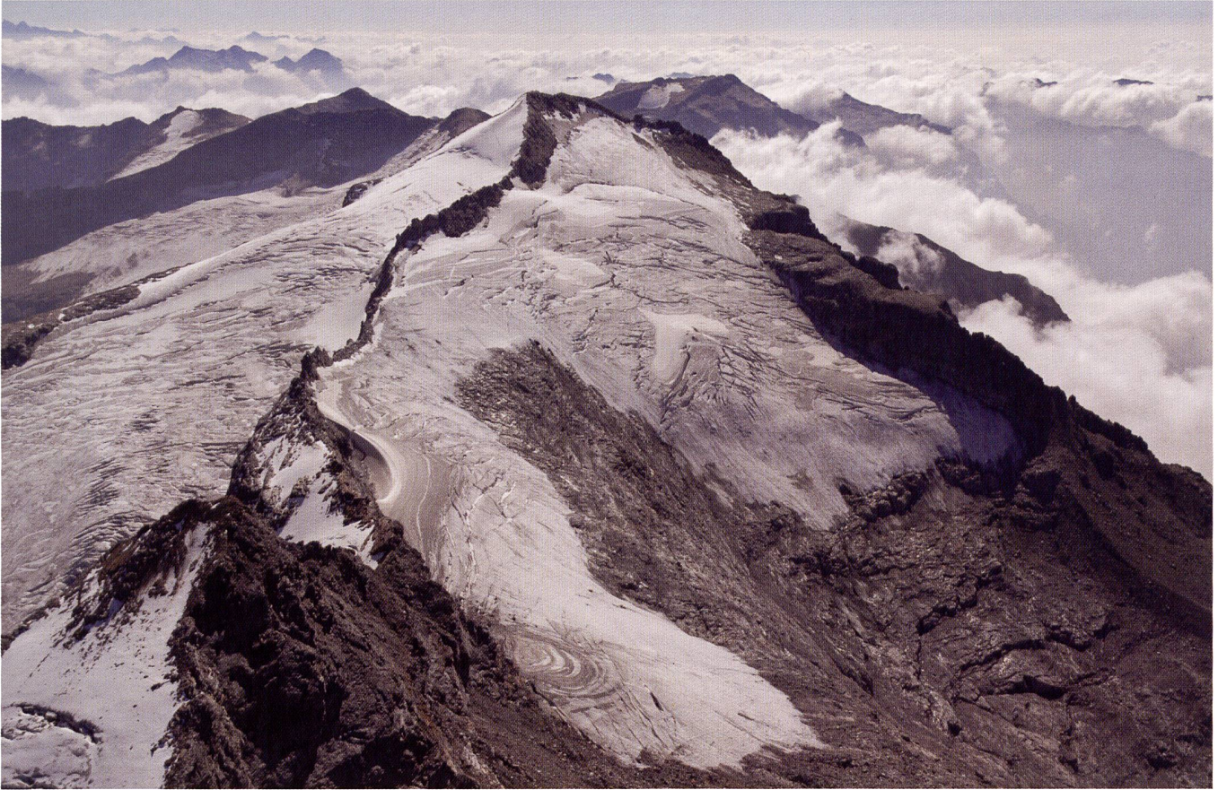
Foto 5 – Il Vadrec di Bresciana (Cima dell'Adula) a inizio settembre 2006 (foto G. Kappenberger).