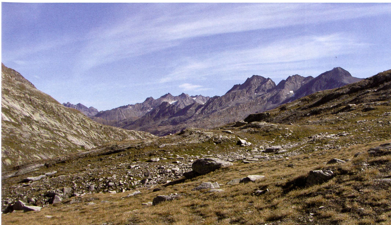
Foto 0.1 – Panorama del versante settentrionale del gruppo dello Scopi e del Piz Medel visto dall'imbocco della Val Cadlmo.

L'ambizione degli autori era di colmare una lacuna di conoscenza sulla geomorfologia della Valle di Blenio, una regione nella quale la conoscenza della geomorfologia regionale è importante tanto per gli studi climatici – il Sud delle Alpi ha un clima molto differente dalle altre regioni svizzere, ciò che ha delle conseguenze importanti sulla morfogenesi – quanto per gli studi sul patrimonio, la protezione della natura e il paesaggio. Speriamo che questo contributo permetta di capire meglio i processi passati e naturali per meglio anticipare i cambiamenti futuri e lo sviluppo di questa bella valle alpina.