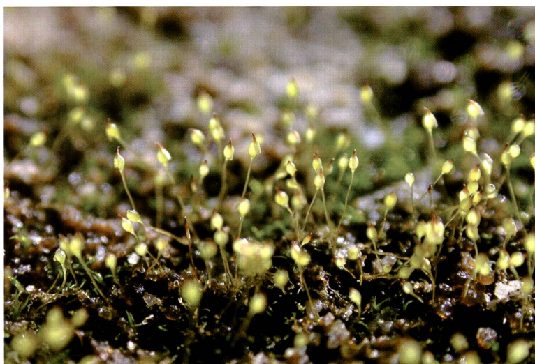
Fig. 1 – Rocce e pietraie di natura calcarea in prossimità del Pizzo Colombe: un ambiente di grande interesse per la flora di briofite calcifile della Val Piora.