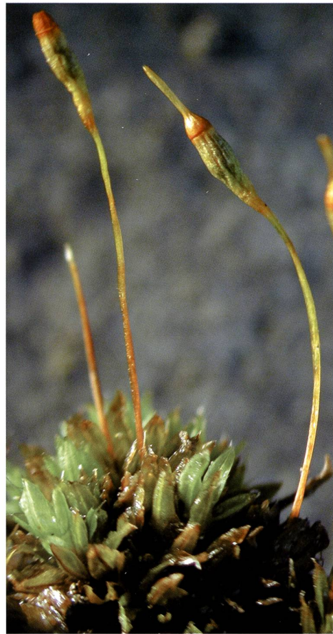
Fig. 3 – Barbula bicolor , il cui nome è dovuto al contrasto cromatico delle cellule della lamina fogliare, è iscritta nella Lista Rossa svizzera con il grado VU (vulnerabile). Si tratta della prima segnalazione per la Val Piora e per il Ticino.