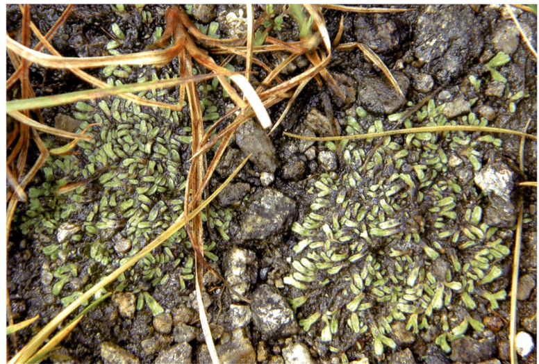
Fig. 5 – Riccia breidleri , una rara epatica iscritta nella Lista Rossa con il grado VU (vulnerabile) e protetta in tutta la Svizzera, è presente in Val Piora nei laghetti di Giübün e Taneda.