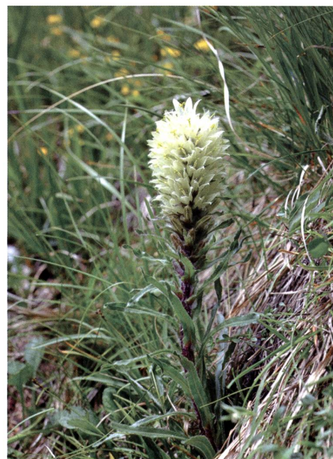
Fig. 3 – Campanula gialla ( Campanula thyrsooides )

peraltro già considerata identificazione incerta dall'osservatore, è quasi certamente erronea. Infatti l'accurata ricerca della specie nella zona indicata non ha dato esito positivo, e tanto meno la specie è stata segnalata in passato nell'area. L'unica popolazione conosciuta è infatti quella scoperta da Dübi nel 1950 presso il Dazio Grande a Rodi (KAUFFMANN 1964) e peraltro non più riconfermata da diversi decenni. Campanula thyrsooides (SA1: EN; fig. 3) rappresenta uno dei tanti elementi di pregio del pascolo secco sopra il Lago Ritóm. La specie era già segnalata da Chenevard (1910) per la Val Piora ed il Gottardo. Anche oggi la sua presenza in Ticino è rara, limitata alla parte settentrionale del Cantone.