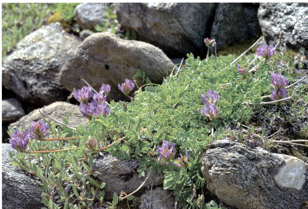
Fig. 2 – Astragalo di Lienz ( Astragalus leontinus )

i prati su substrato acido e le brughiere a arbusti nani ( Agrostis shraderiana , Androsace obtusifolia , Carex brunnescens , Gentiana punctata , Gentiana ramosa , Pulsatilla vernalis , Pyrola minor , Ranunculus kuepferi ) e alcuni taxa difficili da identificare o da osservare ( Cuscuta epithimum , Diphasiastrum alpinum , Hieracium spp., Lycopodium clavatum subsp. monostachyon ). Infine, alcuni taxa nuovi provengono dalle pietraie e rocce calcaree ( Saussurea discolor , Pritzelago alpina s.str., Rharnus pumila , Saxifraga paniculata ). Fra i numerosi taxa non riconfermati, spiccano diverse Orchidaceae, le macrofite acquatiche ( Potamogeton spp.) e alcuni taxa poco frequenti o rari (p.es. Carex bicolor , Euphrasia christii , Sedum villosum ). La mancata riconferma non va interpretata come una perdita di diversità floristica della regione (estinzioni), ma è piuttosto la conseguenza dello sforzo di prospezione relativamente modesto rispetto all'ampiezza della valle.