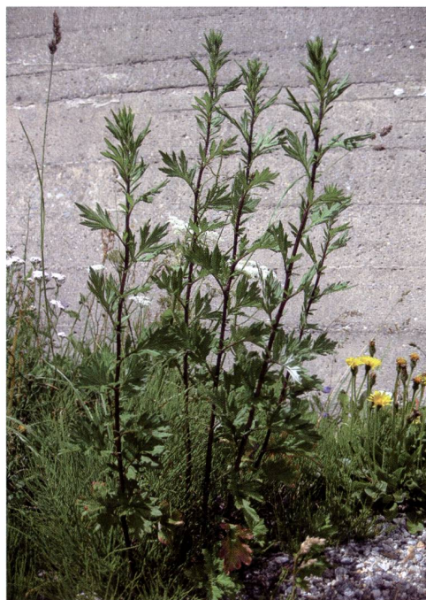
Fig. 4 – Assenzio dei fratelli Verlot ( Artemisia verlotiorum) davanti alla diga del Lago Ritóm.