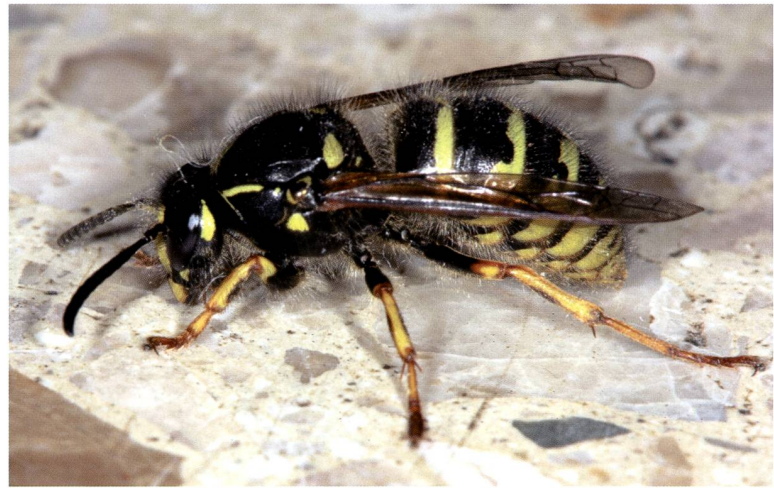
Fig. 2 – Dolichovespula norwegica (Fabricius, 1781).