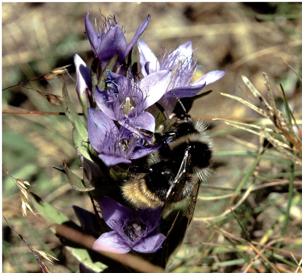
Fig. 4 – Una delle numerose specie di bombi ( Bombus sp.) presenti nei pascoli della Val Piora (su Gentiana campestris ).