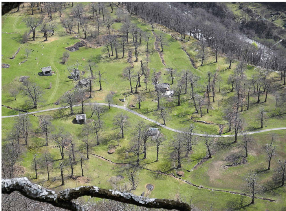
Fig. 2 – Selva castanile Brentan, Comune di Bregaglia.

Da un punto di vista fitosanitario, il problema maggiore è attualmente rappresentato dalla diffusione del mal d'inchiostro ( Phytophthora spp. ) che ha già colpito letalmente ca. 30 castagni maestosi. La fersa del castagno ( Mycosphaerella maculiformis ) e il cinipide galligeno ( Dryocosmus kuriphilus ) hanno un influsso negativo sulla produzione di castagne. Negli ultimi 10 anni anche il cancro corticale del castagno ( Cryphonectria parasitica ) ha ripreso forza, danneggiando le chiome e facendo seccare le giovani piantine. La rinnovazione delle selve è molto importante e quindi, per migliorare questo aspetto, dal 2016 in Bregaglia l'azienda forestale locale ha allestito un piccolo