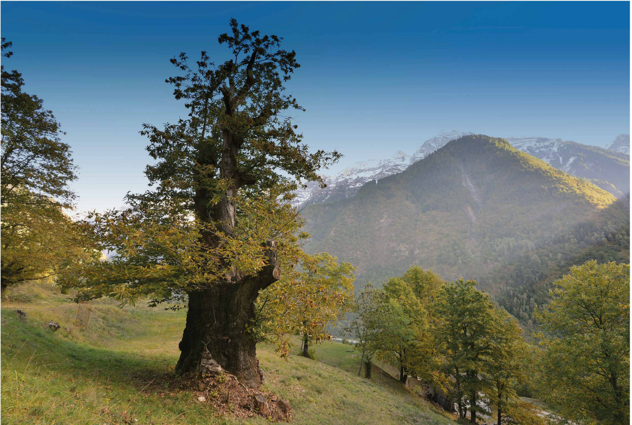
Fig. 5 – Castagno monumentale nella selva castanile Nosall nel Comune di Soazza.

quelle caratterizzate da un tronco centrale predominante, mentre altre varietà come la Luina o Livina hanno chiome contorte. Altre come la Verdanesa si dividono in più branche principali (Conedera et al. 2021, in questo volume). Nelle selve rinnovate dall'inizio del Novecento si trovano anche i marroni. Particolari sono anche i capitozzi, presenti soprattutto a San Vittore e Roveredo. Si tratta di castagni di grosse dimensioni ma regolarmente tagliati a 2-3 metri d'altezza. La chioma dei capitozzi forma dei polloni utilizzati quali paleria nelle vigne del posto.