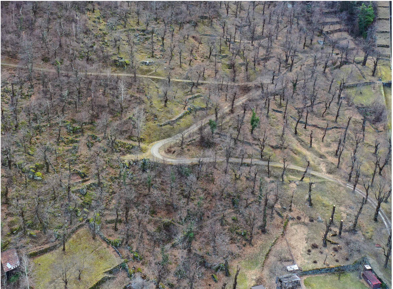
Fig. 3 – Selva a Campocologno, Comune di Brusio.

Le selve castanili e la castanicoltura in Bregaglia sono valorizzate in modo esemplare anche a livello turistico. Ne è testimone il notevole successo delle due settimane del Festival della castagna che si svolgono nel mese di ottobre, quando la valle si riempie di turisti. Dal 2001 si può percorrere un sentiero tematico sul castagno nella selva del Brentan. Nel 2020 è stato attribuito un grande riconoscimento alla castanicoltura della Bregaglia: la castagna essiccata bregagliotta è stata accolta nell'Arca del Gusto Slow Food.