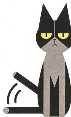
Ich bin aufgeregt und greife vielleicht demnächst an!