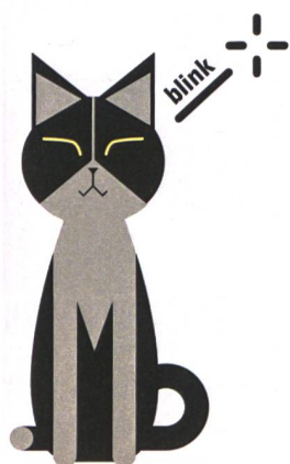
Ich begegne ohne Stress einer Nachbarskatze.