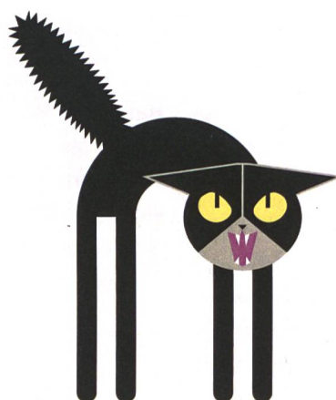
Ich warne dich!