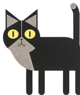
Ich bin zufrieden und alles ist in Ordnung.