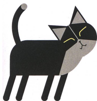
Du gehörst zu mir!

Wie gut der irische Literaturnobelpreisträger seine Katze verstanden hat, wissen wir nicht. Hauskatzen kommunizieren aber auf vielfältige Weise, beispielsweise mit der Stimme oder mit Duftstoffen. Besonders viel über ihren Gemütszustand sagen Körperhaltung und Mimik aus.