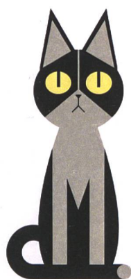
Ich bin interessiert und aufmerksam.