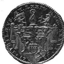
Medaillen des Klosters Muri.