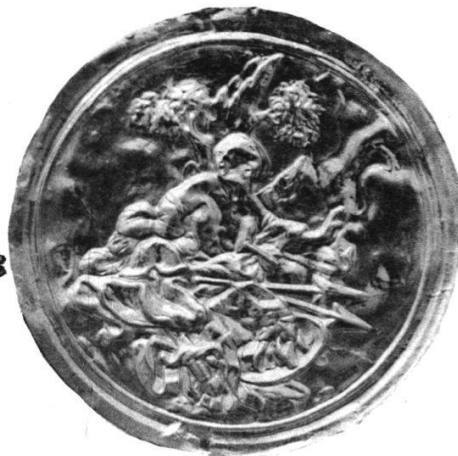
Medaillen des Klosters Wettingen.