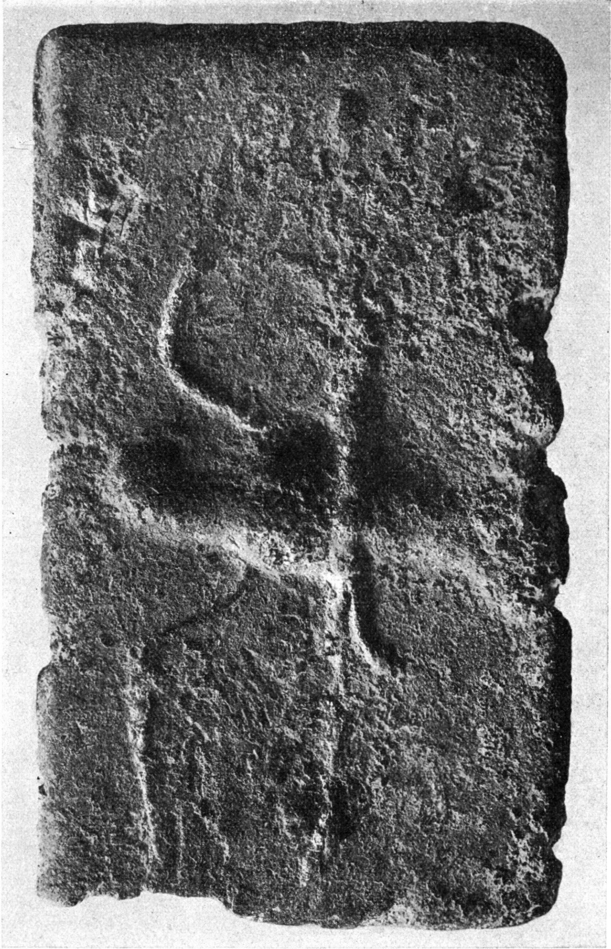
Titelbild (Erklärung Seite 135, vor Nr. 11)