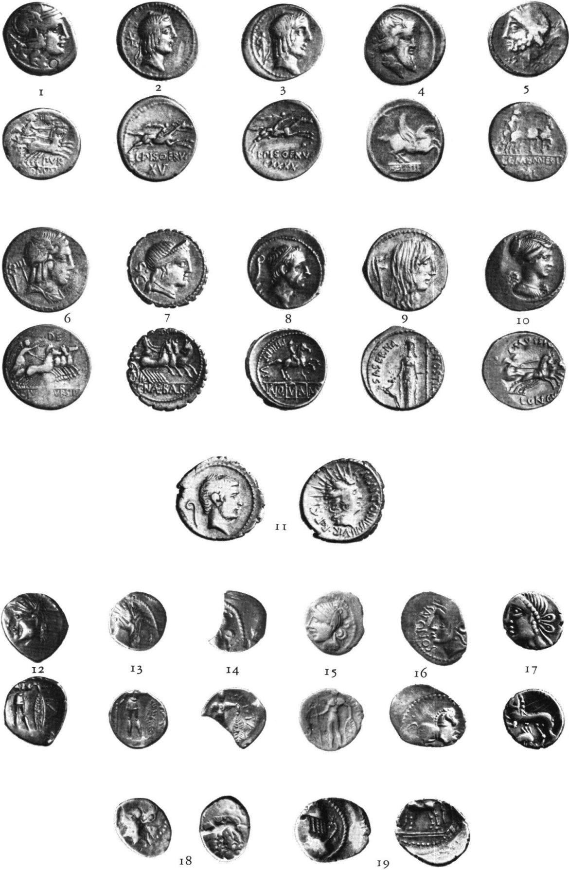
H.-M. von Kaenel, Der Schatzfund von republikanischen Denaren und gallischen Quinaren vom Belpberg