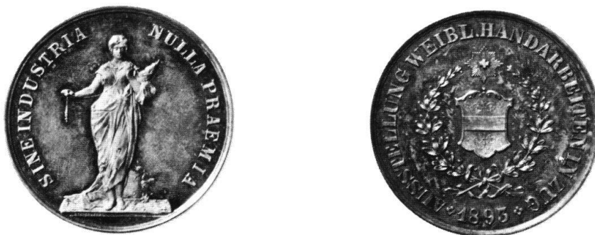
Abb. 4 Die Preismedaille der 1893 in Zug veranstalteten Ausstellung weiblicher Handarbeiten.

Die dritte für die Schweiz bestimmte Prägung, zu der in Stuttgart heute noch Werkzeuge vorhanden sind, ist eine Preismedaille, die 1893 in Zug bei einer Ausstellung weiblicher Handarbeiten ausgegeben wurde. Da dieses sehr seltene Stück bisher erst in zwei Exemplaren nachgewiesen werden konnte – das eine ist als Beleg in Stuttgart