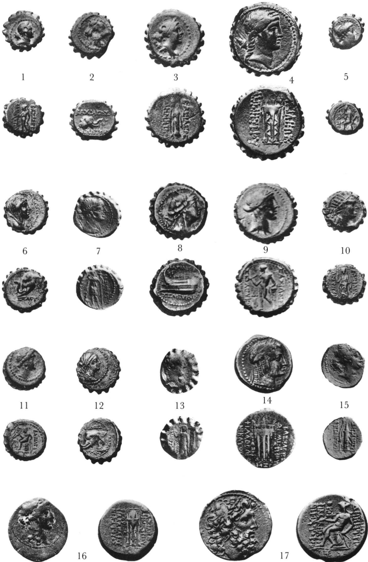
Thomas Fischer (†), Zu den Bronzemünzen des Demetrios I.