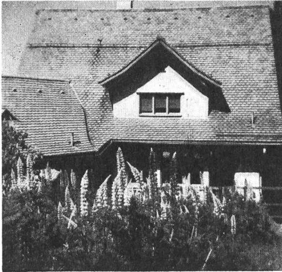
Sommeraugenweide: Das Lupinenfeld beim «Sonneblick».

oder dass eine Zugabe zum Essen, ein Dessert oder Früchte die Lebensgeister hebt, oder eine extra musikalische Darbietung ermöglicht werden kann. Zu diesem Zweck lege ich Fr. 50.— bei und bitte Sie sehr, das Geld im genannten Sinne zu verwenden, ohne jemandem Rechnung abzulegen. Ich hoffe, Sie erfüllen meinen Wunsch. Ich danke Ihnen dafür und grüsse Sie als unbekannt herzlich...» Dass dieser Wunsch erfüllt werden durfte, war eine besondere Erquickung! — Viele Kirchenkollekten sind uns in freundlicher Weise zu-