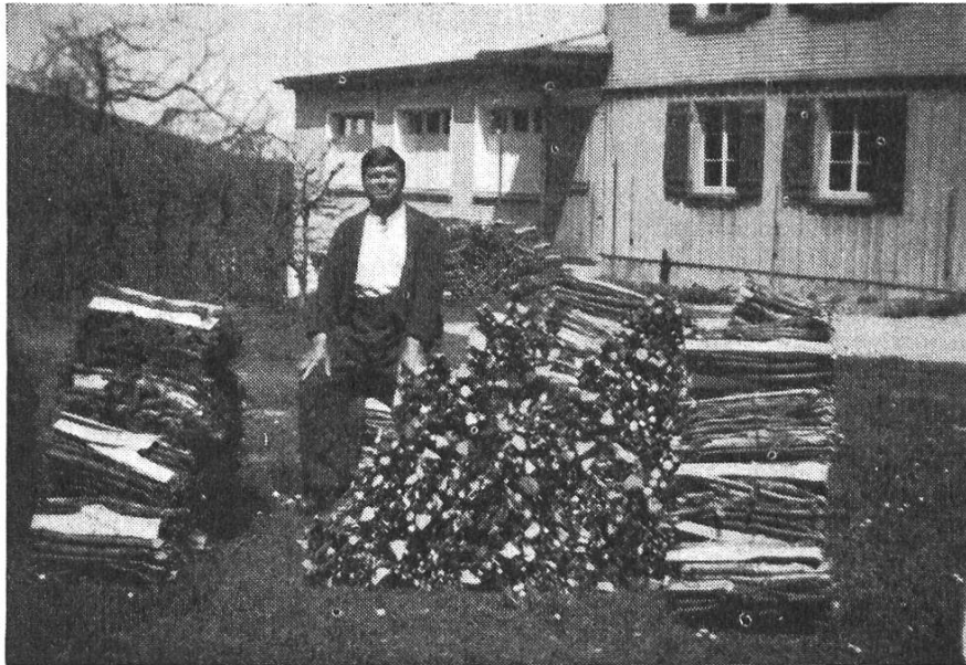
Winteraugenweide: Das Bündelfeld eines Wintergastes.