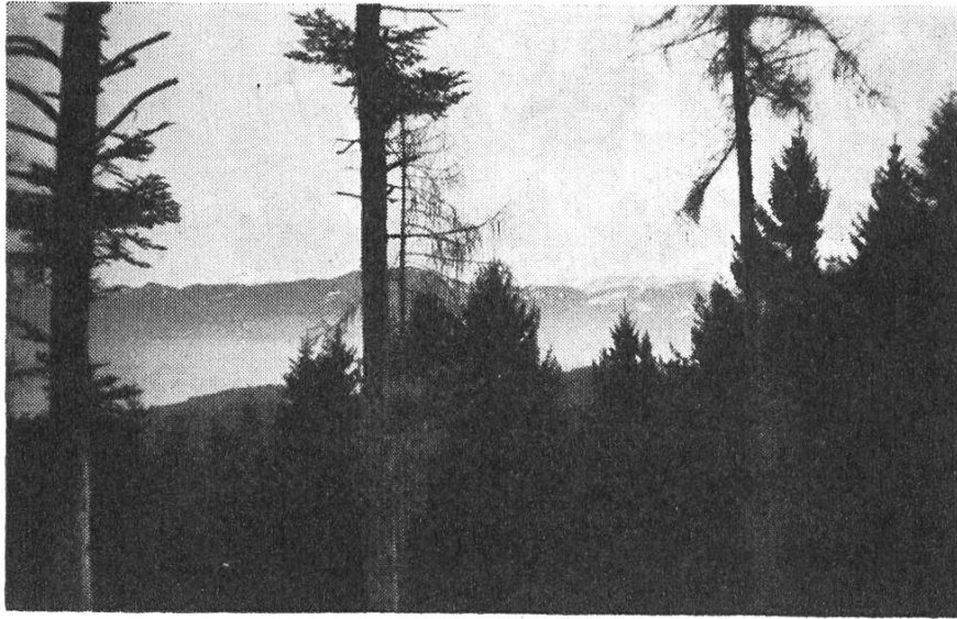
Aussicht vom «Sonneblick» auf die Nebelschleier im Rheintal