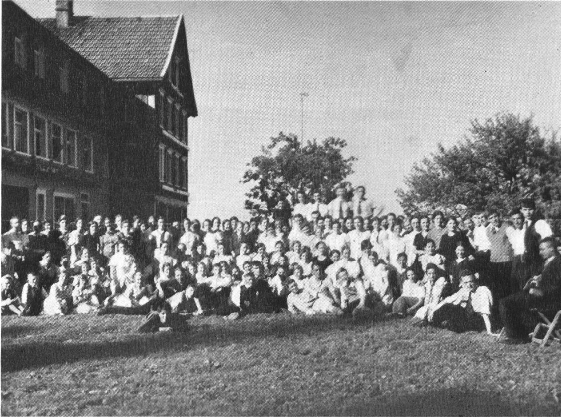
Jugendtagung vor 40 Jahren beim alten «Sonneblick» Brückenschlag zwischen «Sonnenblick»-Dienst und Empfängergeneration

Dann öffnet der Blick in die Ewigkeit – merkwürdig genug für uns oft nur weltbezogene Menschlein – den Blick für das, was eben nottut. Er gibt den Dingen in der Zeit erst den Blick frei. Ewigkeit, unsere Bestimmung von Gott her, schafft erst genug Verantwortungsbewusstsein für die Zeit, darin wir leben.