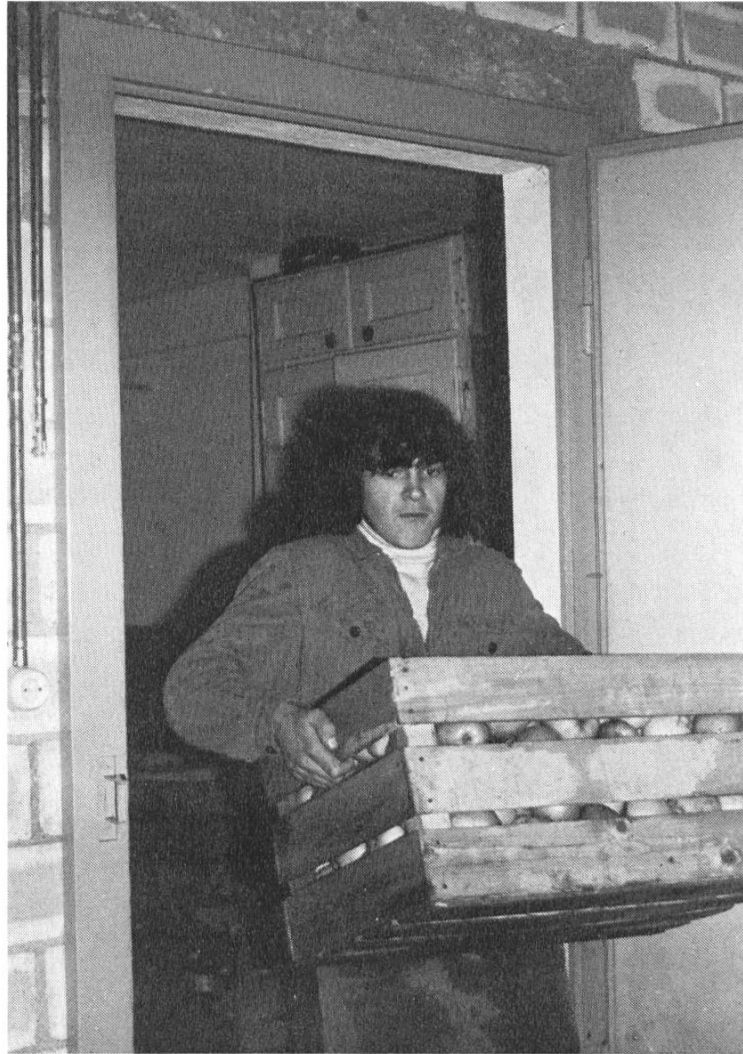
Das Thurgauerobst kommt an

Wir danken der Schweiz. Stiftung für das Alter, die zusammen mit dem St. Gallischen Kirchenrat durch ihren Beitrag uns hilft, die St. Galler-Alterswochen zu finanzieren.