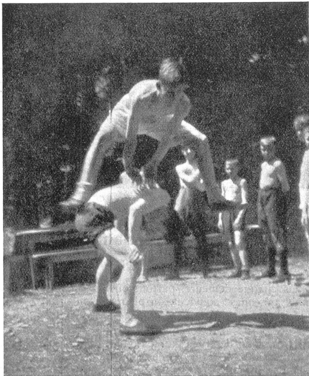
Exercices de gymnastique.

O morts, chers morts de 1918, soyez remerciés, soyez bénis: Fribourg qui se souvient ne vous a pas oubliés et ne vous oubliera jamais, car jamais sa reconnaissance ne sera à la hauteur de votre simple et sublime sacrifice.