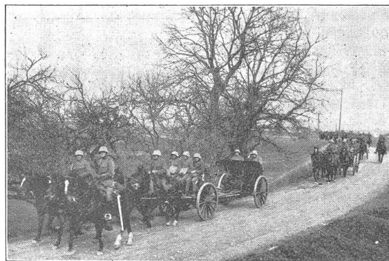
Artillerie auf dem Marsch.

Heute hat die Artillerie der französischen Infanteriedivision neun 7,5 cm Kanonenbatterien und sechs 15,5 cm Haubitzbatterien, die Korpsartillerie neun 10 cm Kanonenbatterien und sechs 15 cm Kanonenbatterien. In