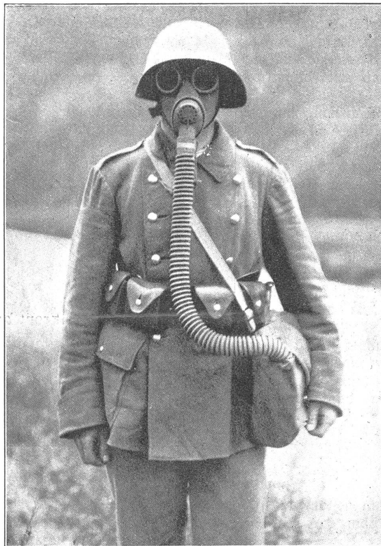
(M. Kettel, Genf.)

Suworoff war ein Draufgänger. Der Bajonettangriff war seine Kampfweise. Als er in Oberitalien den Befehl übernahm, brachte er zuerst den Oesterreichern das Bajonettfechten bei. Ueberall drängte er rücksichtslos vorwärts, bei den anstrengenden Märschen, die er anordnete, kannte er keine Schonung für die Truppe. Aber überall erfocht er Siege.