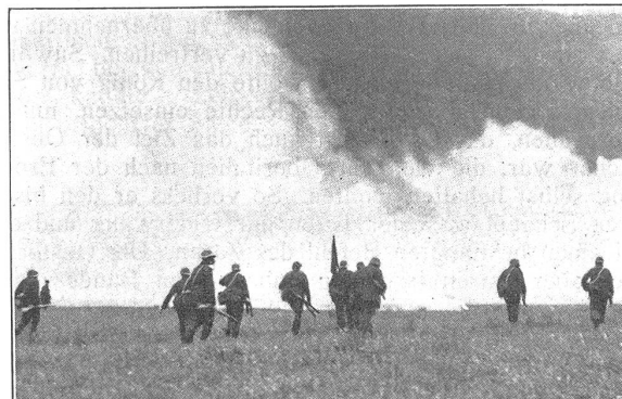
Infanterie rückt unter künstlichem Nebel vor. L'infanterie avance sous la protection d'un rideau de fumée opaque.

«Drei Siebtel» antwortete der Instruktor kaltblütig und zündete sich eine Zigarette an.