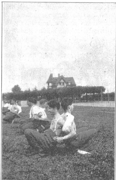
Wagen in Rückenstellung.

lande Bürger wohnen, die gewillt sind, weder Zeit noch Mühe zu sparen, um an der Ertüchtigung unserer Jugend und damit an der Festigung unseres Vaterlandes nach innen und nach aussen mitzuhelfen. Es ist das heute vielleicht notwendiger denn je; heute, wo ihrer Verantwortung unbewusste Schwätzer an jahrhundertealten und bewährten Einrichtungen des Staates rütteln und dadurch die stetige Weiterentwicklung unseres Volkes gefährden.