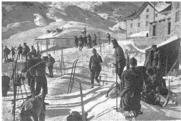
Vor der Abfahrt auf Gotthard-Hospiz. Avant le départ pour l'hospice du St-Gothard.

Die nachfolgenden Arbeitstage, die leider nicht von schönem Wetter und guten Schneeverhältnissen begünstigt wurden, waren sehr streng und wurden bis auf die Minute gut ausgenützt. Die Normaltagesordnung für alle Klassen war ungefähr folgende: