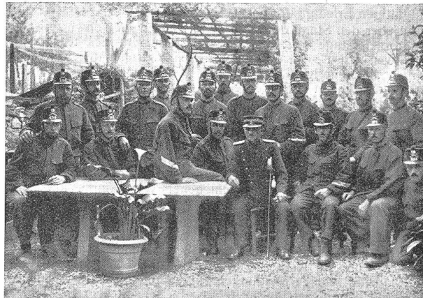
Auch wir lesen den «Schweizer Soldat» mit Vergnügen! Nous aussi nous lisons le «Soldat Suisse» avec plaisir!