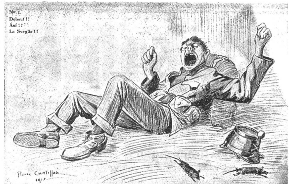
Auf! — Debout!