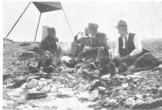
Auf dem Titlis.

Der 28. August war kalt und regnerisch. Am 29. dislozierte die Kompagnie nach Trübsee. Mit der Saumkolonne musste der Jochpass tags vorher zweimal hin und zurück gemacht werden. Der schlechten Witterung wegen konnte man nicht an das Kampieren denken, wie geplant war. Beim Rückmarsch am 29. nach Trübsee regnete es wieder unerbittlich. Ohne Zwischenfall gelangten wir aber ans Ziel und bezogen Kantonnements