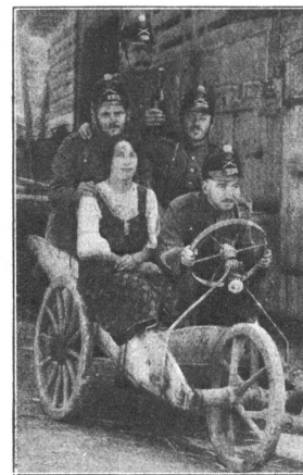
Mit 120 km Geschwindigkeit! Du 120 à l'heure !