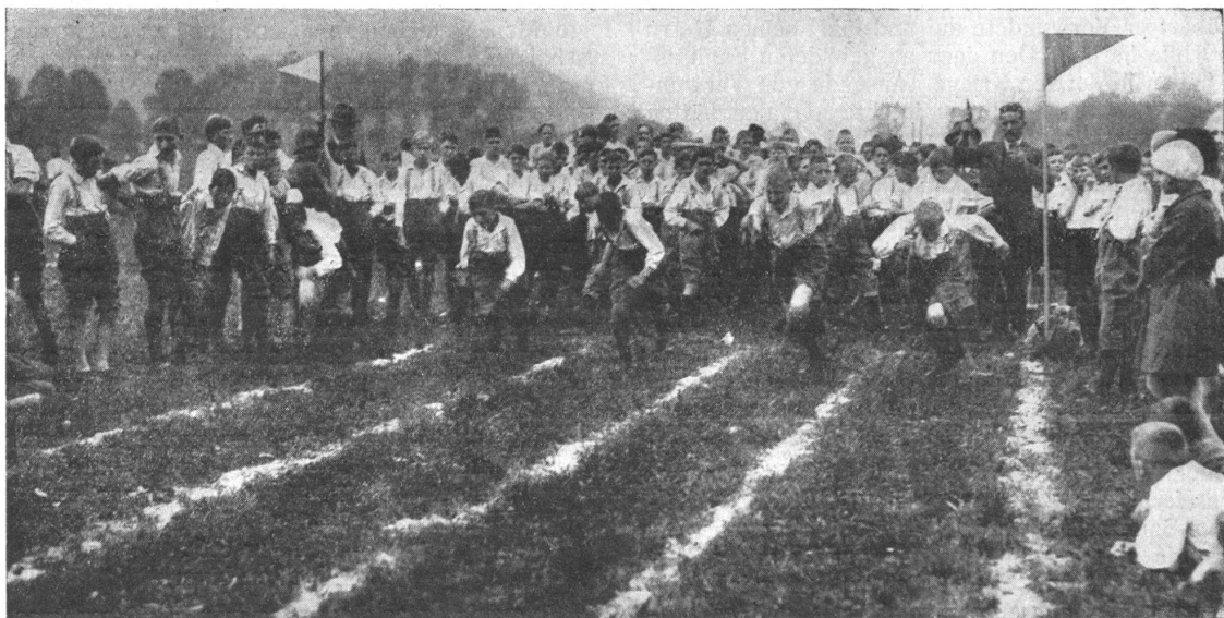
Wettlauf. — Une course de vitesse.

Wer die Jugend hat, der hat die Zukunft für sich. Das wissen die Gegner des Kadettenwesens vor allem aus dem Lager der sozialdemokratischen Antimilitaristen sehr wohl. Deswegen lassen sie auch keine Gelegenheit vorbeigehen ohne die bewährte Institution zu bekämpfen. Selbstverständlich gilt der Kampf nicht den harmlosen Kadetten, sondern unserem gesamten Wehrwesen schlechtweg. Vor allem sollte dazu die Revision des Schulgesetzes benutzt werden, indem der Antrag gestellt wurde, den Kadettenunterricht von der Liste der obligatorischen Bezirksschulfächer zu streichen. Um das Gesetz nicht von vorneherein zu gefährden gaben die unter sich in dieser Frage nicht völlig einigen bürgerlichen Parteivertreter im Grossen Rate ihr Einverständnis zu einem Kompromiss, nach dem die Gemeinden über die Beibehaltung oder Abschaffung der Kadettenkorps zu bestimmen gehabt hätten. Wäre diese Fassung Gesetz geworden, so wären in Zukunft die Versammlungen der Bezirksschulgemeinden zum alljährlichen Schauplatz leidenschaftlicher Kämpfe geworden, wie es Aargau jetzt schon ist. Anlässlich der zweiten Gesetzesberatung nahmen sich mehrere antimilitaristische Redner derart aggressiv dass bei der Abstimmung unter Namensaufruf viele bürgerliche Grossräte die das erste Mal für den Kompromiss gestimmt hatten, sich für die Beibehaltung