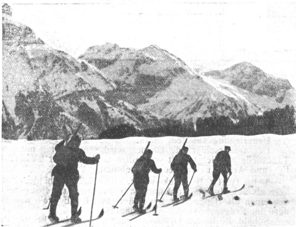
Skipatrouille auf der Fahrt, im Hintergrund der Juchlipass.

Die Geb.-J.-Br. 10 hat im letzten Winter in der Kaserne Andermatt über die Neujahrs-Feiertage einen siebentägigen Skikurs , in der Hauptsache für Unteroffiziere und Soldaten, durchgeführt.