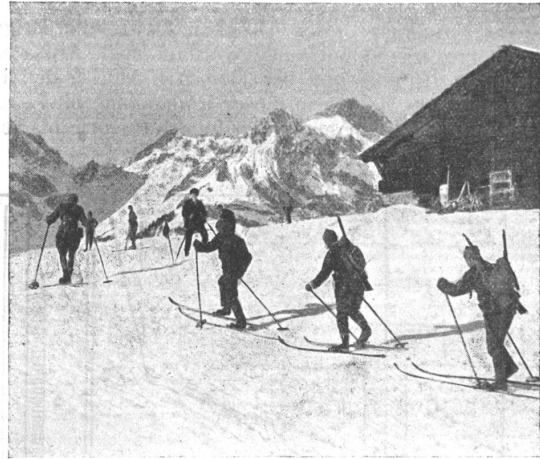
Patrouille auf der Strecke Gerschnialp, im Hintergrund der Hahnen, das Wahrzeichen Engelbergs.