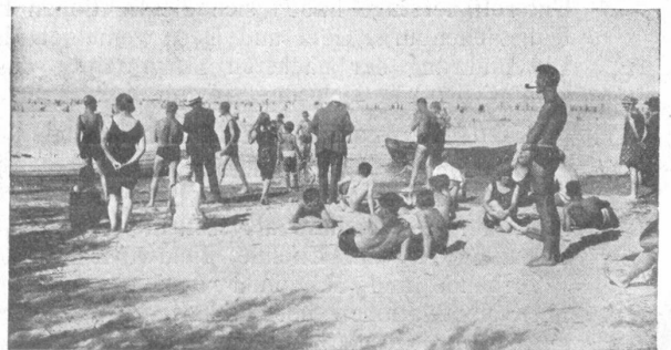
Strandbad. — La plage.