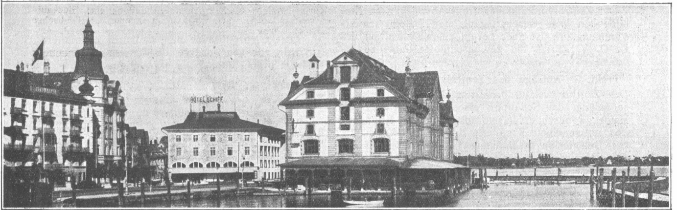
Hafenansicht-Hafenplatz. — Le port et la place du port.