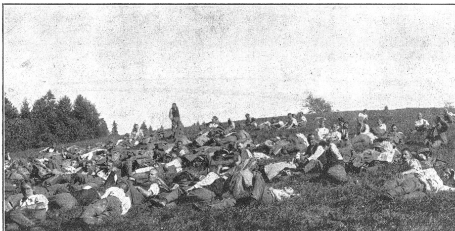
Landwehr im Dienst. — La landwehr en service.

Gruppenführers, der den fleissigen Waldarbeitern möglichst nicht in den Weg zu treten sich befliss, mit dem Fällen der grössten Juratannen. Aber am Dienstagmorgen schlich die Gruppe missmutig und müde den Wald hinauf. Die Köpfe schmerzten und die grosse Waldsäge blieb immer wieder stecken. Wir waren alle zu schlapp zum Fluchen und als um 9 Uhr der Pfiff ertönte, der uns das Recht zu der Einnahme der Zwischenverpflegung und einer halbstündigen Pause gab, liessen wir Käse, Tee und Brot im Brotsack und warfen uns schweigend unter die «Chriesäste». Weit jenseits des Bewusstseins hörten wir wohl mal einen Pfiff, aber es war uns alles Wurst, wir hatten das Impffieber; wir litten unter der Reaktion . . . Uns weckte die bekannte, nicht sehr sympathische