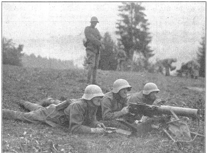
Landwehr im Dienst. — La landwehr en service.

Die alten Grenzsoldaten erinnern sich noch, wie in den ersten Wochen der Grenzbesetzung die ganze Armee geimpft wurde — und zwar gegen Pocken. Ueber die Opportunität dieser Massenimpfung in diesem Zeitpunkt