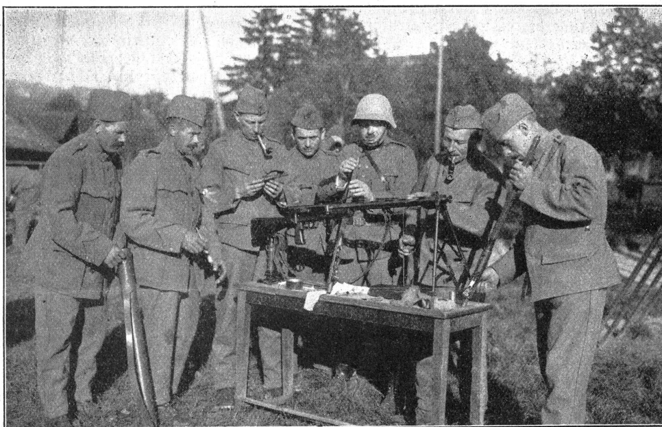
Landwehr im Dienst. — La landwehr en service.

Wege einer freiwilligen Requisition — aber am vierten Tage kam ganz unerwartet, mitten in einen Schieber hinein, ein Leutnant von den Wallisern mit einer kleinen Armee, der mit dünnen Worten die Ablösung verkündete. Die Wachübergabe vollzog sich schnell, der Herr Leutnant fand unsern Wigwam als zu unkomfortabel für seine Kriegerschar und zog sich in die einen Kilometer weiter zurückliegende «Vacherie» zurück — wir aber, wir zogen mit gesenktem Blick in das Philisterland zurück und uns ahnte allerlei. Beim Einmarsch in die Residenz markierten wir allerdings das frisch, fromm, froh und sangen schallend: «Es kam ein Knabe gezogen»; wir platzten gerade in die vom Hauptverlesen zurückströmenden Kameraden unserer Kompagnie hinein und mit gewaltigem Hallo oder hämischem Grinsen wurde uns mitgeteilt, der Hauptmann hätte eine Rede gehalten, den Arbeitseifer teilweise gelobt und teilweise getadelt und, um ein