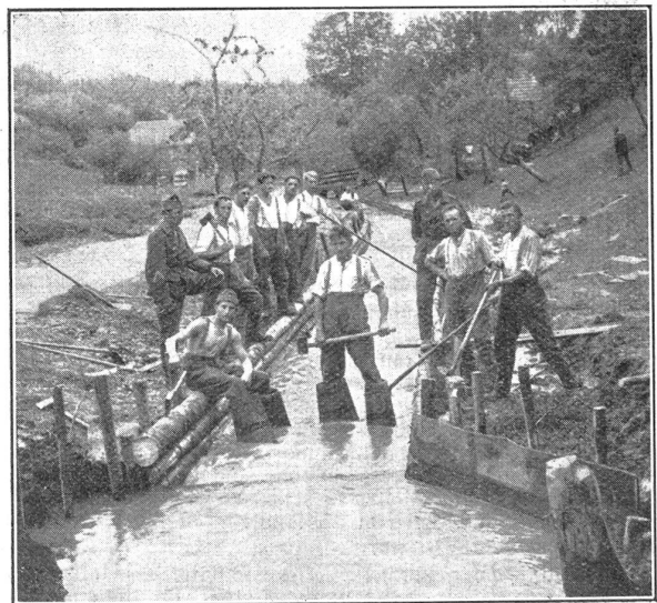
W. K. 1931 des Sap.-Bat. 3 im Unwettergebiet des Emmentals. Der Wildbach in Fesseln.