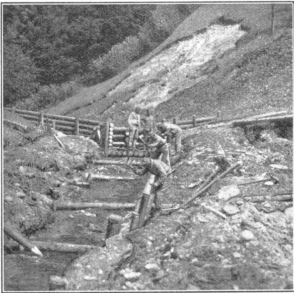
W. K. 1931 des Sap.-Bat. 3 im Unwettergebiet des Emmentals. Der wilde Bergbach erhält ein neues Bett.

C. R. 1931 du Bat. Sap. 3 dans les régions dévastées de l'Emmenthal. — Le ruisseau impétueux dans son nouveau lit.