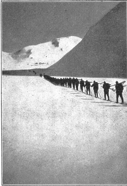
Kolonne über den Oberalpsee zu den Baracken (im Hintergrund). — Colonne sur le lac d'Oberalp se dirigeant vers les baraques (dans le fond).

zwei Scharfschützenkompagnien — anvertraut. Am 9. Juni traf die von den Piemontesen abgeschnittene österreichische Besatzung von Laveno auf drei Dampfern in Magadino ein und wurde entwapfnet. Zehn Tage später konnten die Grenztruppen bis auf einige Bataillone entlassen werden.