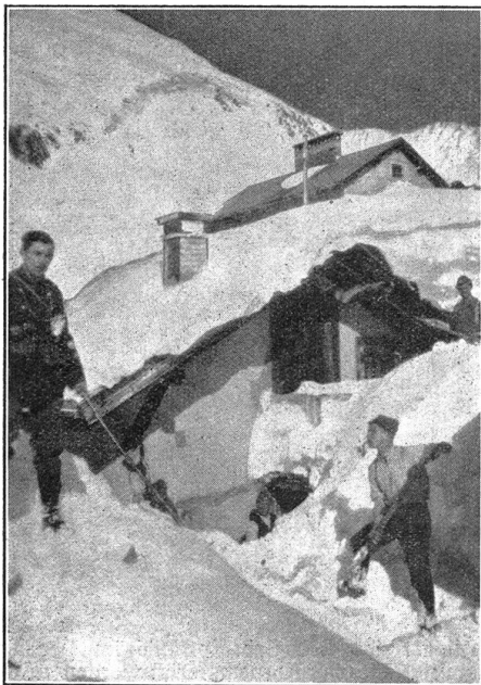
Die vom Schnee ganz eingedeckten Baracken werden freigeschaufelt. — Dégagement des baraques complètement enfouies sous la neige.

Im Schein der Petroleumlampe fahren die Farbstifte, raschelt Papier. Auf der Ofenkunst schnarcht schon einer. Es wird spät. Allmählich sickert zu mir die Kunde durch, dass es in der Küche heisse Milch gebe. Die «Füs» haben natürlich zuerst ihr Teil und Entdeckerrecht genommen. Ein inspizierender Rundgang führt mich über eine stockdunkle Treppe ins obere Stockwerk. Irgendwo glüht eine rote Ritze im Dunkel. Ich