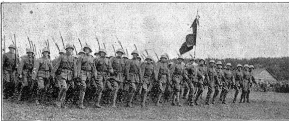
Defilé der 1. Division. — Die Infanterie. Défilé de la 1er Division. — L'infanterie.

Die Uebungen haben wiederum gezeigt, welche grosse Bedeutung im Gebirge den Maschinengewehren, besonders den schweren, zukommt. In dem steilen, stark durchschnittenen Gelände, können sie, wenn flankierend eingesetzt, zu ausserordentlicher Wirkung kommen, und dabei doch so geschickt aufgestellt sein, dass sie vom Gegner kaum zu fassen sind. Im Verbindungsdienst zeigte sich, dass im Gebirge bei oft grossen Distanzen und beträchtlichen Höhenunterschieden die Blinkverbindungen den Drahtverbindungen überlegen sind; sofern die Witterung nicht einen Strich durch die Rechnung macht und das Blinken verunmöglicht. Die Sappeure haben beim Ausbau der Verteidigungsstellung