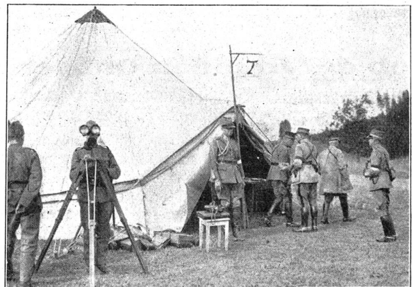
Manöver der 3. Division. — Manceuvres de la 3e division. Kommandoposten auf Gumm. — Poste de commandement sur Gumm. (Hohl, Arch.)

Eine andere Schwierigkeit für Rot lag in der Unkenntnis der feindlichen Massnahmen. Die Fliegeraufklärung musste in diesem Gebiet versagen, trotz der fliegerischen Ueberlegenheit von Rot, weil die blauen Hauptstellungen wie die Sperrstellungen in den Wäldern gegen Fliegersicht gedeckt waren. Besser war es für die blauen Flieger, die auch den roten Vormarsch feststellen konnten, weil die Bewegung der Truppenkörper auch in diesem Gebiete doch ersichtlich war. Für Rot bedeutete diese Unkenntnis der blauen Stellungen den Zwang zu vorsichtigem Vorgehen. Einmal vor die Sperrstellungen gelangt, wusste es nicht, wie es das gute Feuer derselben einzuschätzen hatte, und musste, angesichts der vielen und gut postierten Maschinengewehre und Begleitgeschütze, seine Kolonnen entwickeln, womit es viel Zeit verlor.