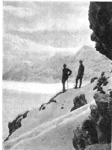
Abendstimmung über dem Kanderfirn Crépuscule sur le glacier de Kander