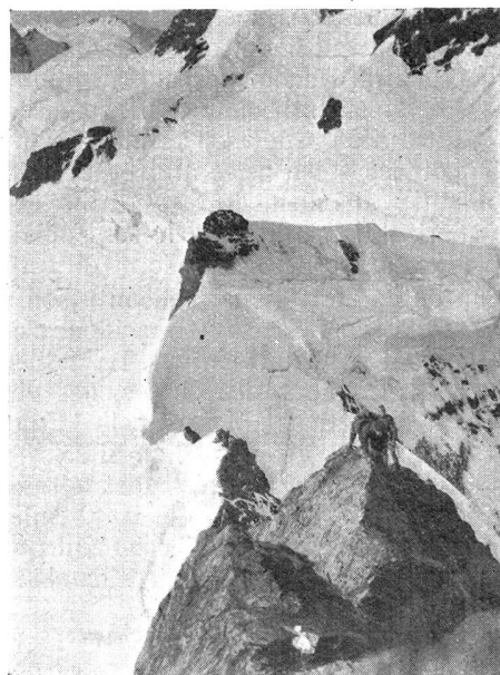
Ueber den Südwestgrat zum Mönch empör. Ein kurzes Stück geht es über harten Firn, dann folgt der Einstieg in die Felsen.