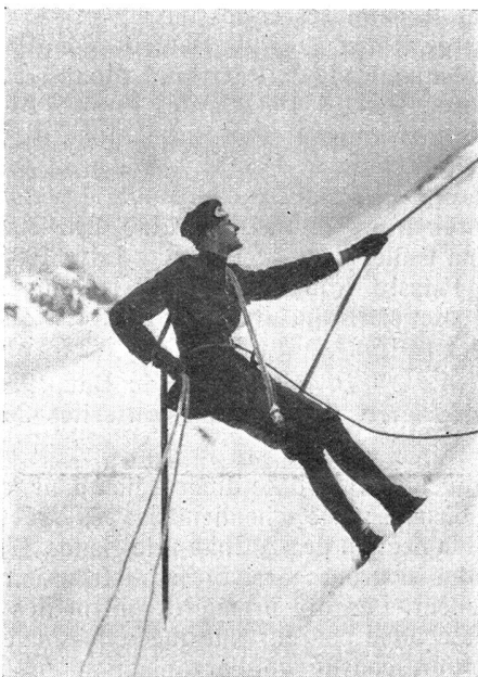
Mit Hilfe von zwei Seilen wird eine Eiswand passiert Avec l'aide de deux cordes une paroi de glace est franchie

Mais le faisceau se resserre et l'étoile de Nicole pâlit sous les témoignages de plus en plus nombreux qui le montrent comme le grand responsable. Tous ses acolytes ne sont que de vulgaires pantins dont il a tiré les ficelles, qu'on se rappelle l'effondrement d'Isaak après