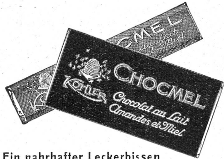
Ein nahrhafter Leckerbissen

WERKSTÄTTE FÜR MODERNE KOMBINATIONS-POLSTERMÖBEL ZÜRICH 1 / UNTERER MUHLESTEG 2 / TELEPHON 53.141