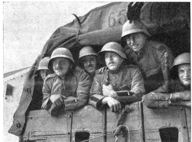
So sollte es nach Biel gehen Que cela aurait été gai d'aller ainsi à Bienne

Das Verhalten und der Geist der Truppe waren ausgezeichnet. Es wurde mit einem Ernst und einer Umsicht gearbeitet, die nur gereiften Menschen eigen sind. Die zeitweilige erhöhte Alarmbereitschaft stellte unbequeme Anforderungen an den einzelnen Mann; die Sonne brannte oft recht unangenehm auf die schwere Uniform, und das Gefühl, während den herrlichen Pfingsttagen, fern der Familie, Ordnungsdienst zu leisten, war auch nicht sehr erfreulich. Aber trotz alledem unterstellte sich jeder willig und mit großem Pflichtgefühl den Anordnungen des Platzkommandos. Jeder war voll Eifer und mit dem besten Willen beseelt, seine Aufgabe voll und ganz zu erfüllen. Ueberall herrschte nur ein Gedanke, man wollte nicht provozieren, aber man wollte auch nicht länger provoziert werden. Einer solch innerlich gesammelten