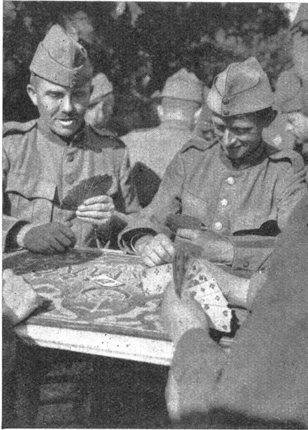
Der erste Jaß im Wehrkleid nach langen Jahren wieder Quel plaisir, après de nombreuses années, de «refaire» le premier Jass en uniforme

Dann erwacht in allen Unteroffizieren, dem ganzen Grade und dem einzelnen, neu der währschafte, der verantwortungsbewußte Schweizerwille: «Alle für einen, einer für alle!» — und ihre bürgerliche, wie ihre militärische Aufgabe erntet den Segen der kameradschaftlichen Aufmunterung. Neue Kraft wird sie erfüllen, mit neuem Glauben werden sie sich dem Ruf des Vaterlandes fügen, mit immer weiterem Blick, mit stets freudigerer Dreingabe ihrer selbst der Gesamtheit dienen!