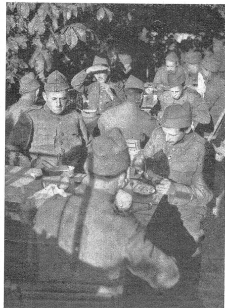
Verpflegung — La soupe

Dieser Geist ist es denn auch, in dessen Zeichen wir hoffen und erwarten, daß die Tagung des Schweizerischen Unteroffiziersverbandes verlaufen möge. In diesem Geiste will sie wie bis anhin dem Wohl des Heers, und durch das Heer, dem Wohl des Vaterlandes dienen. Wenn dieser Geist die Arbeit unseres Festes trägt, wenn Mann für Mann davon durchdrungen ist, wenn er alle Anstrengungen adelt, dann haben wir dem Ideal gedient.