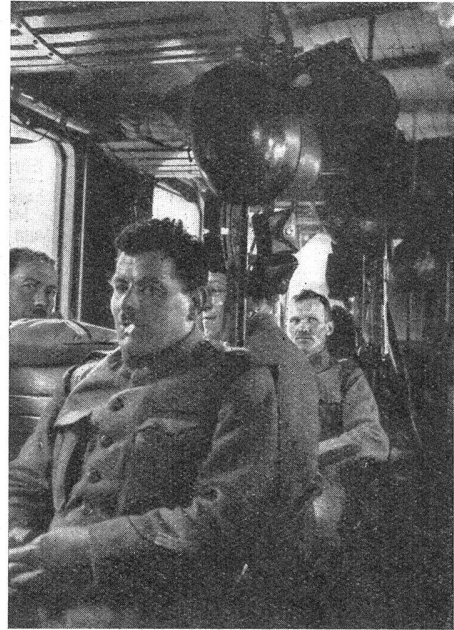
Bahntransport Transport par chemin de fer

Aber diese Kraft des Heeres, das Zerstreute zusammenzuraffen, das Gesammelte beisammenzuhalten und zusammenschweißen, sie beruht im letzten Grunde doch auf dem «Dienst», auf der Leistung jedes ein-