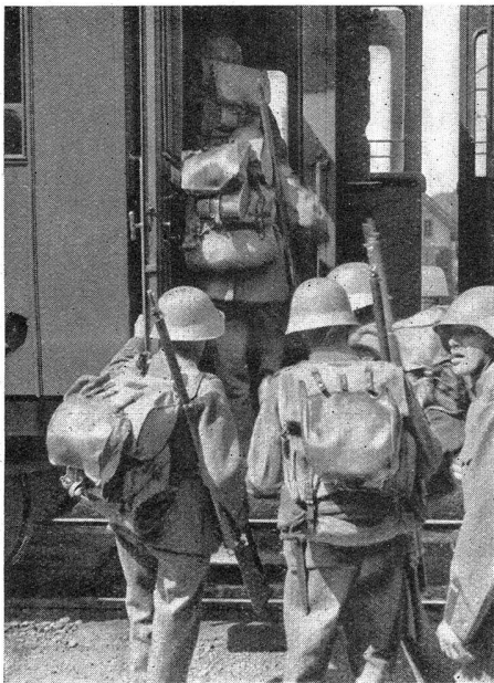
Bahnverlad in Burgdorf