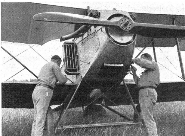
S. U. T. Genf. Wettübungen der Fliegertruppe: Demontage eines Flugzeuges. Nach dem Kommando: „An die Arbeit!“ werden die verschiedenen Kabel der Tragflächen gelöst. — J. S. S. O. Genève. Exercices pour pionniers-aviateurs: Démontage d'un avion. Après le commandement « au travail! » on détache les câbles-porteurs des ailes.